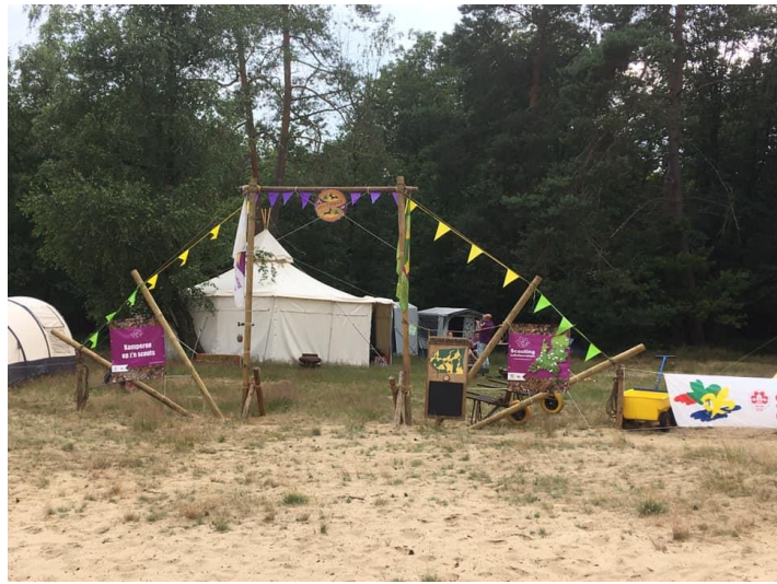
Nieuwe staffent € 3300