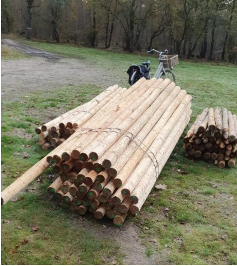
Nieuw pionierhout € 1200