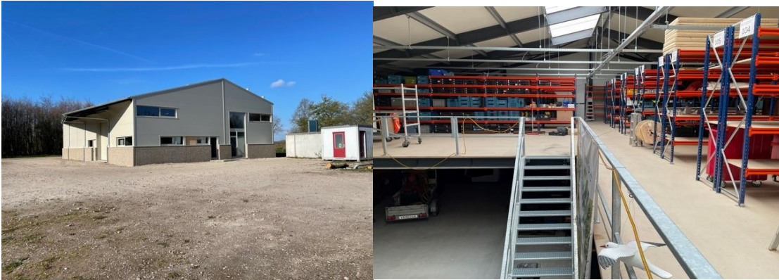
Magazijn Kraaiennest buitenkant en binnen bovenverdieping