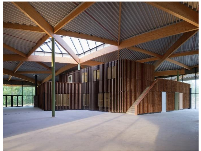
Avonturenhuis foto's van buiten en binnen kant. Foto's van TOMDAVID en MOST-Architecture