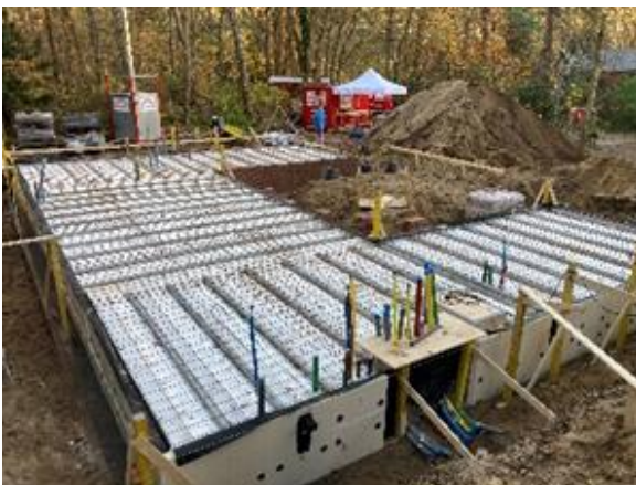
Start nieuwbouw stafhuis € 322.000